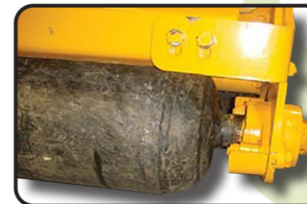
▶ Verstärkte Stützwalze