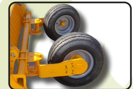
▶ Orientierbare Räder