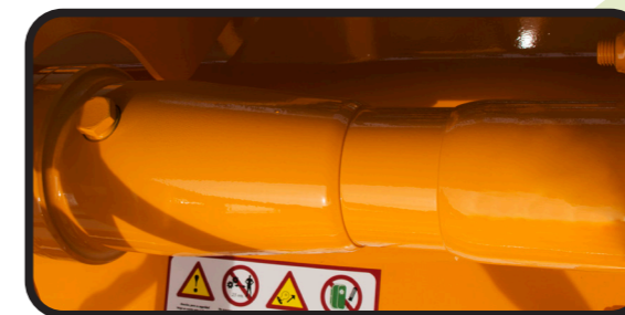
▶ Rueda libre en la manga