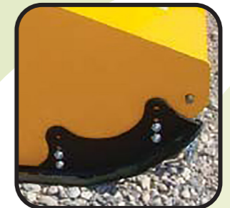
▶ Vordere Gleitkufen für die gerade Seite