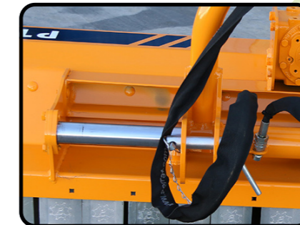
▶ Hydraulische Seitenverschiebung