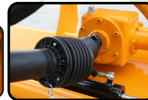
▶ Getriebe mit Freilauf