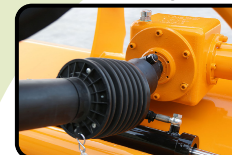
▶ Getriebe mit Freilauf