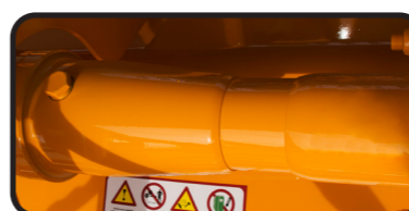
▶ Arm mit Freilauf