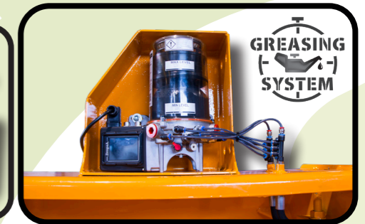
▶ Automatisches Befüllungssystem