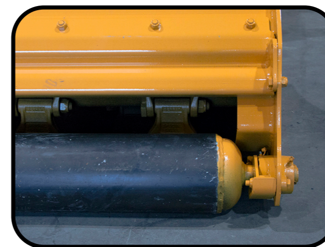
▶ Höhenverstellbare Stützwalze