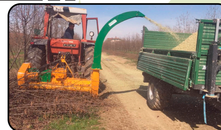
▶ Hohe Auswurf-Düse