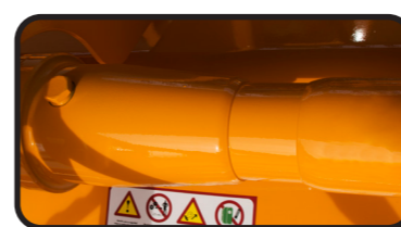
▶ Arm mit Freilauf