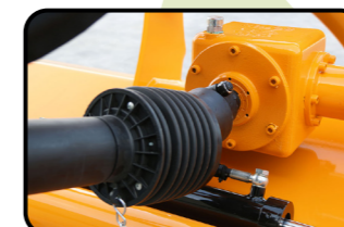
▶ Getriebe mit Freilauf