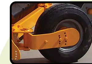
▶ Orientierbare Räder