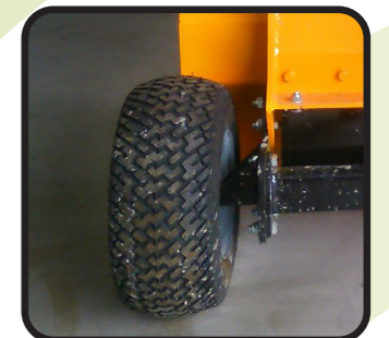
▶ Orientierbare Räder