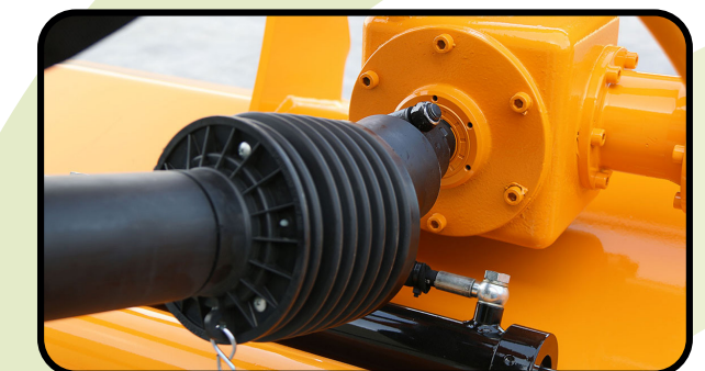
▶ Getriebe mit Freilauf